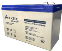
BATERIA 12V - 7.0 A ULTRACELL

Codigo: 08010 Marca: ULTRACELL UL7-12 $10.780 +iva