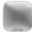
SIRENA INALAMBICA EXTERIOR AJAX WH

Codigo: 18012 Marca: GARRISON LK-102P-RM $10.160 +iva