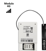
MODULO GPRS 4G LIGHTSYS PLUS

Codigo: 08008 Marca: ULTRACELL UL18-12 $40.220 +iva