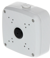
CAJA SOPORTE CONEXION DAHUA BALA EXT 13.4X13.4X5CM

Codigo: 10633 Marca: DAHUA DH-PFA6400S $85.650 +iva