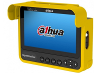
TESTER CCTV DAHUA ANALOGO HDCVI AHD TVI CVBS PANTALLA

Codigo: 10247 Marca: DAHUA PFB2203W $9.640 +iva