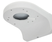
SOPORTE DAHUA EXTERIOR DOMO A MURO BASE 16X12.2X7.6CM

Codigo: 10693 Marca: DAHUA DH-PFB7320W-SG $150.980 +iva