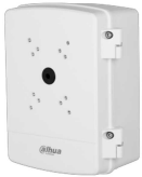
CAJA CONEXIÓN DAHUA IP66 8KG ALUMINIO

Codigo: 10633 Marca: DAHUA DH-PFA6400S $85.650 +iva