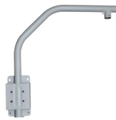
SOPORTE PTZ DAHUA CON BRAZO EXTENDIDO 87X83X18CM

Codigo: 10244 Marca: DAHUA PFA150-V2 $21.900 +iva