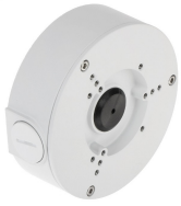
CAJA SOPORTE CONEXION DAHUA REDONDA 12.4X4.1CM IP66

Codigo: 10241 Marca: DAHUA PFA130-E $12.590 +iva