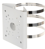
SOPORTE DAHUA MONTAJE POSTE 13X17X4.5CM φ8-15CM

Codigo: 10241 Marca: DAHUA PFA130-E $11.690 +iva