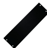
BDN TAPA CIEGA 4U RACK 19 NEGRA

Codigo: 15022 Marca: BDN BDN-B2U $13.300 +iva