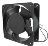
BDN TURBINA VENTILADOR 12X12CM 220VAC

Codigo: 15021 Marca: BDN BDN-B1U $8.780 +iva